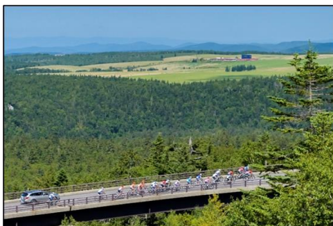
9/8 第1ステージ 美瑛町希望橋 64km付近