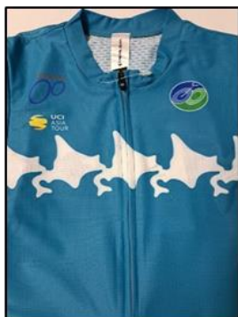
個人総合ポイント賞